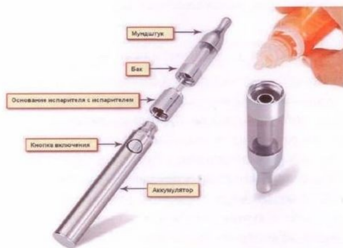
Рис. 3. Устройство электронной сигареты

Обычная электронная сигарета состоит из аккумулятора, электрического испарителя, емкости для жидкости, мундштука и дополнительных элементов для автоматического управления подачей ароматизированной жидкости (но последние имеются не во всех моделях), рис.3.