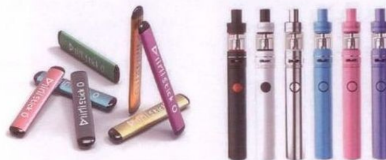
Рис. 5. Одноразовые (слева) и многообразные (справа) электронные сигареты

Одноразовые ЭС рассчитаны на 200 - 500 затяжек пара. В многообразных устройствах нет таких ограничений и они работают до тех пор, пока доливается жидкость в емкость.