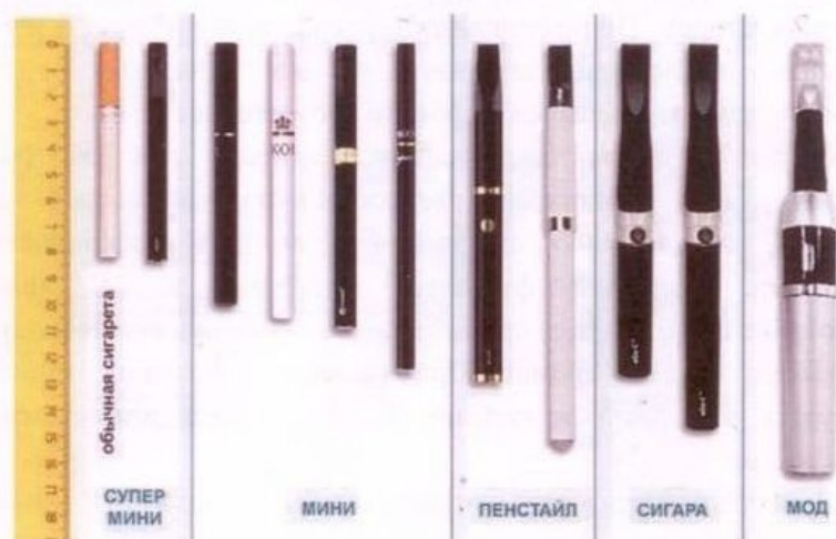
Рис.4. Типы и размеры электронных сигарет

Электронные сигареты (вейпы) классифицируются также по типу и размеру (рис.4) в соответствии с длиной (от 82 мм до 175 мм).