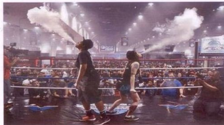
Рис. 2. Вейпинг соревнование

Быстрому распространению курения ЭС (вейпингу) способствуют компании-производители, которые превратили курение ЭС в целую субкультуру. В мире на регулярной основе проводятся субсидируемые компаниями-производителями выставки и соревнования среди курильщиков ЭС (рис.2). Это так называемые: «Cloudchasing» (мастерство выдувания облаков пара), «Tricks» (трюки с паром) и «Вейпинг-алхимия» (соревнования по составлению новых жидкостей для вейпа).